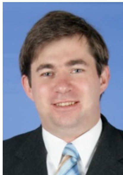
Alle Ratsarbeit bringt aber nicht viel, wenn sie nicht öffentlich wird!

Alle Ratsarbeit bringt aber nicht viel, wenn sie nicht öffentlich wird! Bei den begrenzten Wuppertaler Lokalmedien können wir uns nicht darauf verlassen, dass schon über unsere Arbeit berichtet wird. Das müssen wir selber erledigen. Dazu dienen natürlich zum einen diese Blauen Seiten , mit denen wir ihnen regelmäßig einen Einblick in einen Teil unserer Arbeit geben wollen. Zum anderen haben wir aber auch das Mittel der Zielgruppenbriefe intensiv genutzt zu letzte an die Elberfelder Einzelhändler) oder die Bürgerinnen und Bürger über Hausverteilungen über unsere Forderungen informiert (gerade aktuell am Toelleturm).