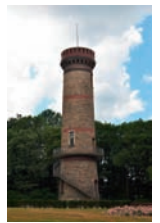
Der Toelleturm - Namensgeber und Wahrzeichen für ein in jeder Hinsicht wertvolles Wohnviertel unserer Stadt