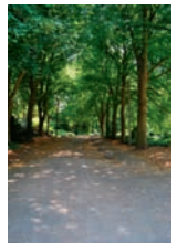
„Am Grünen Streifen“

Ein schönes Beispiel dafür, dass die Zusammenarbeit von Anwohnern und ortsnaher Politik zu Ergebnissen führen kann.